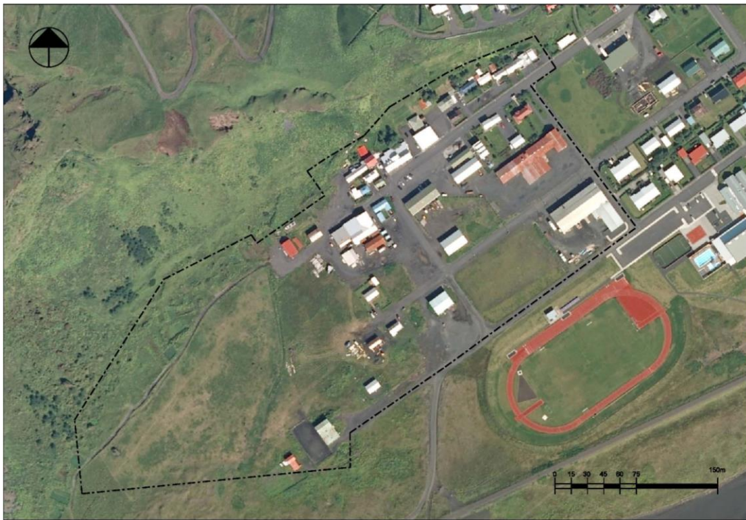
Mynd 1. Afmörkun á deiliskipulagssvæði.

Deiliskipulagssvæðið er um 10,5 hektarar að stærð. Svæðið er þegar byggt en á suður hluta þess eru óbyggðar lóðir en svæðið hefur ekki verið deiliskipulagt áður. Flestar lóðir svæðisins eru í eigu sveitarfélagsins. Stór hluti skipulagssvæðisins varð verndarsvæði í byggð skv. lögum nr. 87/2015 með samþykkt ráðherra í febrúar 2020 og skal deiliskipulagsáætlunin vera í samræmi við skilmála verndarsvæðisáætlunarinnar.