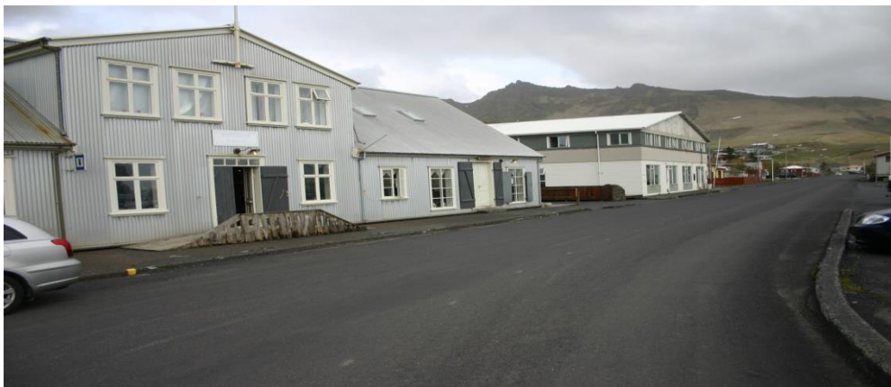
Mynd 3. Brydebúð við Víkurbraut.

Í deiliskipulagi skal skv. lögum um menningarminjar nr. 80/2012 fjallað um friðaðar og friðlýstar minjar. Allar fornleifar, hús og mannvirki, 100 ára og eldri eru friðaðar og er óheimilt að haggja við þeim án leyfis Minjastofnunar Íslands. Um friðlýstar minjar gilda strangari verndarákvæði og flokkast þær sem þjóðminjar. Engar friðlýstar minjar voru skráðar á deiliskipulagssvæðinu árið 2004 né innan verndarsvæðis í byggð árið 2018, en 28 hús eru 100 ára eða eldri og þannig friðuð. Samráð verður haft við Minjastofnun Íslands um fyrirkomulag þess svæðis sem ekki var skráð árið 2018.