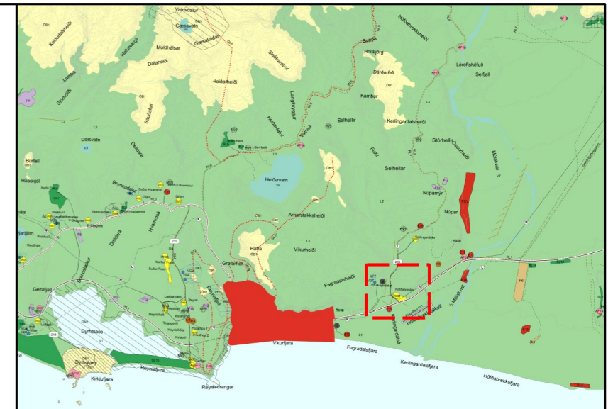
Hluti sveitarfélagsuppráttar aðalskipulags Mýrdalshrepps 2021-2033

Aðalskipulagsbreyting þessi sem auglýst hefur verið skv. 31. gr. skipulagslaga nr. 123/2010 var samþykkt í sveitarstjórn þann _____.