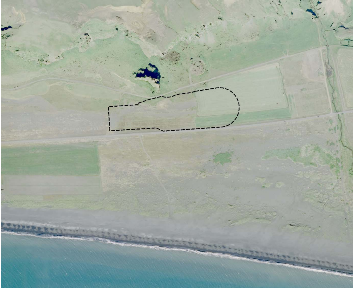
Mynd 2. Loftmynd af skipulagssvæðinu

Svæðið er mjög flatlent á uppgrónum sandi sem á tímabili nýtt sem tún (sjá mynd 2).