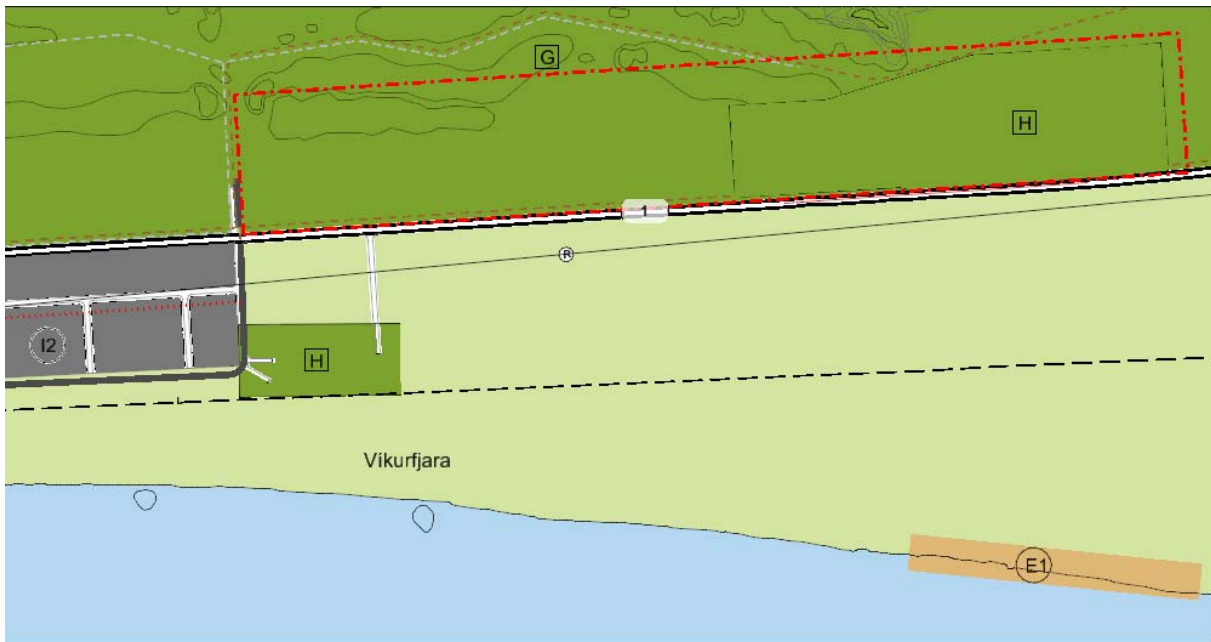
Mynd 1. Aðalskipulag Mýrdalshrepps 2012-2028, H er staðsetning deiliskipulagssvæðið.

Deiliskipulag þetta fellur ekki undir lög um umhverfismat áætlana nr. 105/2006.