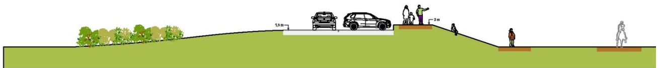
Mynd 4. Snið í gegnum bílastæði og mön fyrir áhorfendur við keppnissvæði.

Lögð er áhersla á að skapað verði skjólgott svæði með skjóli frá ríkjandi vindáttum og rýmið verði aðlaðandi. Mön er umhverfis keppnissvæðið en byggja á fyrst upp norður og austur hluta manar til þess að mynda skjól og setbrekku fyrir áhorfendur. Halli í setbrekkum skal miðast við að vera 1:3 og að það verði stallur á milli bílastæðis og göngustígar, sjá mynd 4. Á skipulagsupprætti er gróður sýndur til skýringar en æskilegt er að plantað verði og sett upp skjólbelti til þess að mynda skjól.