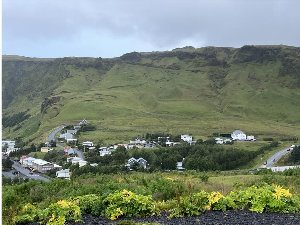
Bakkar. Mynd ágúst 2022.

Íbúðir innan skipulagsins skulu vera að lágmarki 55m 2 að stærð, nema annars sé getið í sérskilmálum fyrir einstakar lóðir.