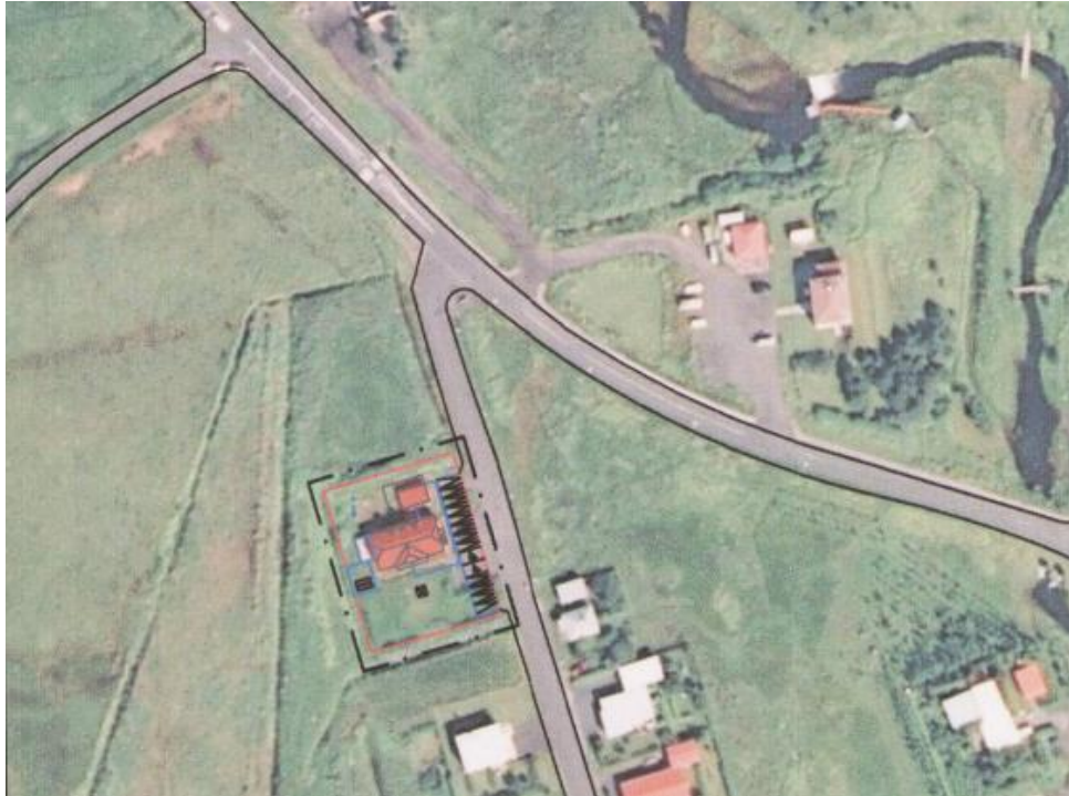
Hlutamynd úr uppdrætti deiliskipulagsins Mýrarbraut 13.

Hér verður lýst þeim almennu skilmálum sem gilda fyrir svæðið.