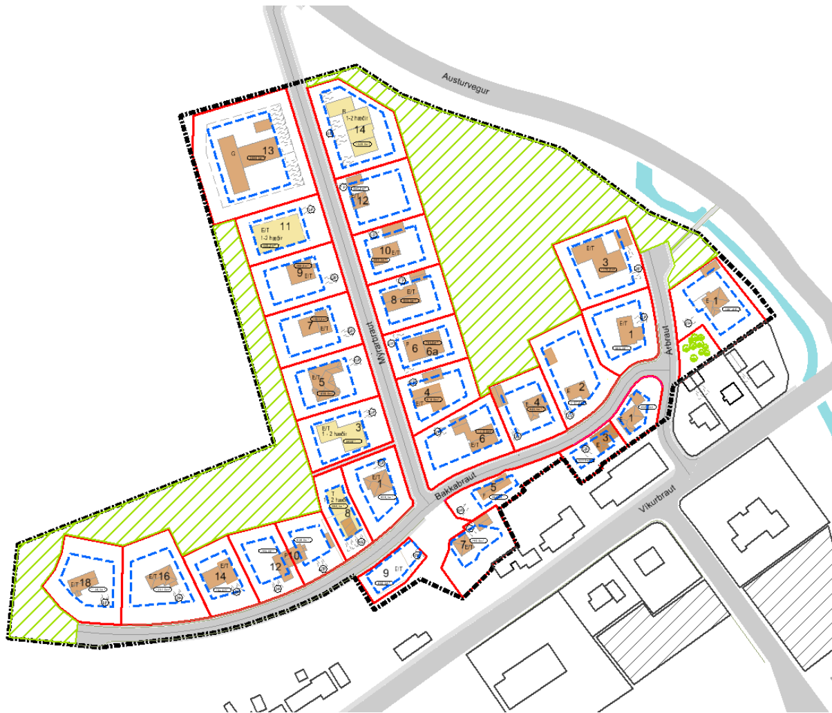
Afmörkun deiliskipulagsins Bakkar.