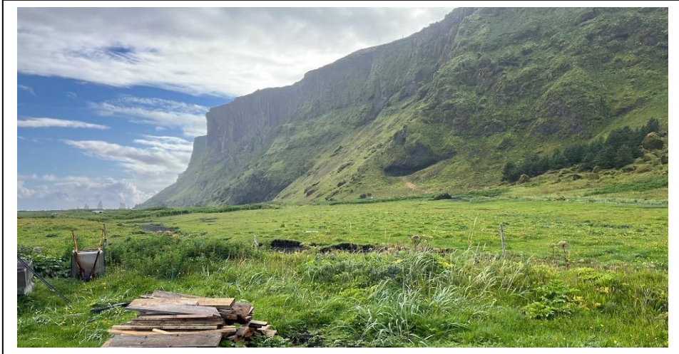
Greinagerð deiliskipulags Bakka