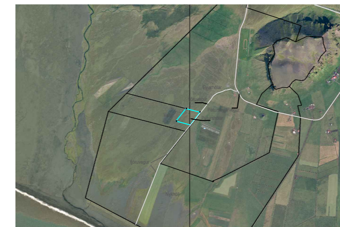
Yfirlitsmynd yfir Péturshóla og fjöruveg, 1:50.000 [A2]