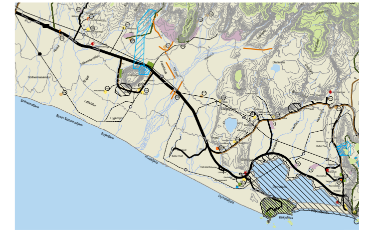
Aðalskipulag Mýrdalshrepps 2012-2028, 1:200.000 [A2]

Skipulag vega innan lóðar Péturshóla má sjá á meðfylgjandi uppdrætti. Útfærsla vega og bílastæða gæti hliðrast eitthvað, en áætlað er að lega þeirra verði eins og sýnd er á uppdrætti. Gert er ráð fyrir minnst tveimur bílastæðum við hvert hús.