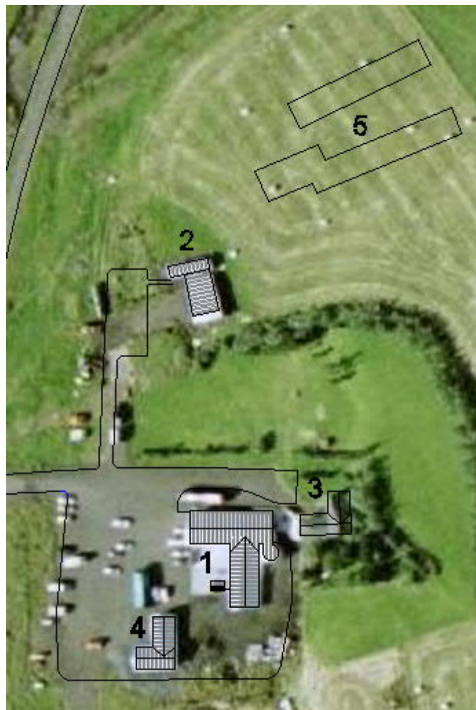
Mynd 3 Staðsetning bygginga

Skipulagssvæðið er girt fjárheldri girðingu og innan þess er búið að rækta skjólbelti og gróðursvæði umhverfis íbúðarhúsið. Húsá rennur skammt vestan við Mýrdalsjökulsveg. Aðkoma inn á skipulagssvæðið er um núverandi heimreið frá Mýrdalsjökulsvegi sem einnig er heimreið að svæðum með landnúmerum L163037 og L210360. Mynd 3 sýnir staðsetningu núverandi bygginga.