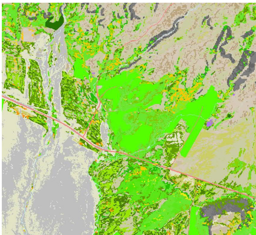
Mynd 4 Vistgerðir á skipulagssvæðinu. Skjáskot af Vistgerðarkorti Níiii.

Innan skipulagssvæðisins er að finna tún og akurlendi ásamt víðimóavist, hraungambravist og flagmótavist sem eru vistgerðir sem hafa lágt til miðlungs verndargildi. Starungsmýravist og língresis- og vingulsvist hafa hátt og mjög hátt verndargildi. Innan svæðisins er ekkert náttúrufríbærni sem fellur undir sérstaka vernd vistkerfa og jarðminja samkvæmt 61. grein laga um náttúruvernd nr. 60/2013. ii Svæðið telst ekki mikilvægt fuglasvæði skv. Vistgerðarkorti Náttúrufræðistofnunar Íslands.