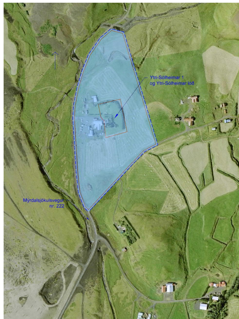
Mynd 2 Svæðið sem deiliskipulagið nær til

Mýrdalsjökulsvegur (nr. 222) liggur meðfram vesturmörkum svæðisins og Ytri-Sólheimavegur (nr. 2285) er suð-austurmegin við þau. Á Ytri-Sólheimum 2 er búfjárrekstur, en þar stendur einnig Sólheimakapella. Afleggjari frá Ytri-Sólheimaveg liggur til suðurs að þremur frístundahúsum sem standa u.þ.b 100 m sunnan við syðsta horn skipulagssvæðis. Frístundahús stendur einnig skammt frá, við Sólheimahjáleiguveg. Á Sólheimahjáleigu er rekið fjárbú og ferðaþjónusta með gistingu.