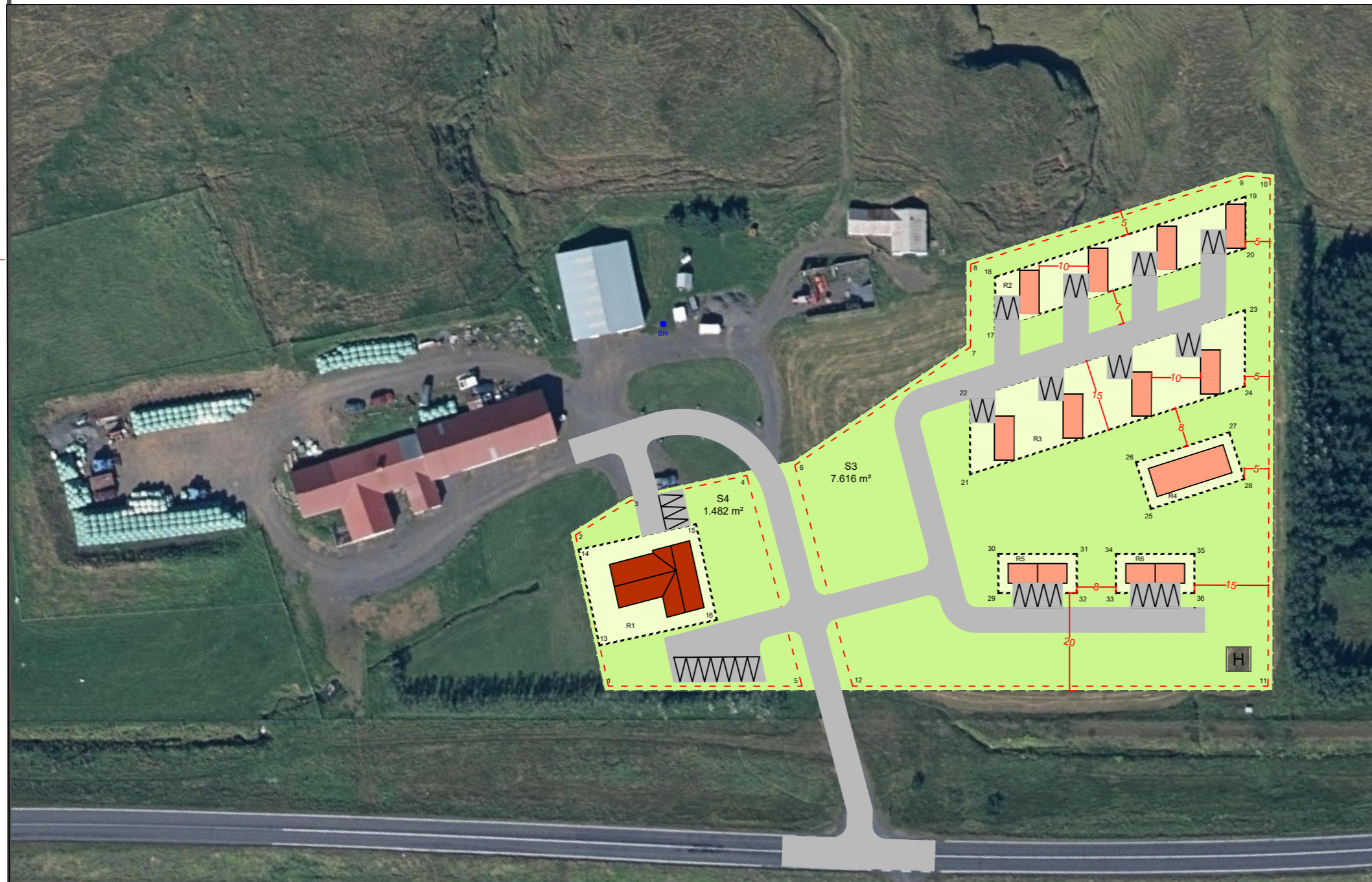
Deiliskipulagsuppráttur mkv. 1:1000