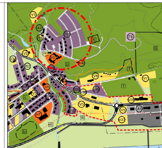
Yfirlitsmynd úr aðalskipulag AÐALSKIPULAG VÍK Í MÝRDAL 2012-2028, HLUTAUPPRÁTTUR

SAMÞYKKTIR: Aðalskipulagsbreyting þessi sem fengið hefur meðferð í samræmi við ákvæði 1. mgr. 36. gr. skipulagslaga nr. 123/2010 var samþykkt í _____ þann _____ 20__ og í _____ þann _____ 20__.