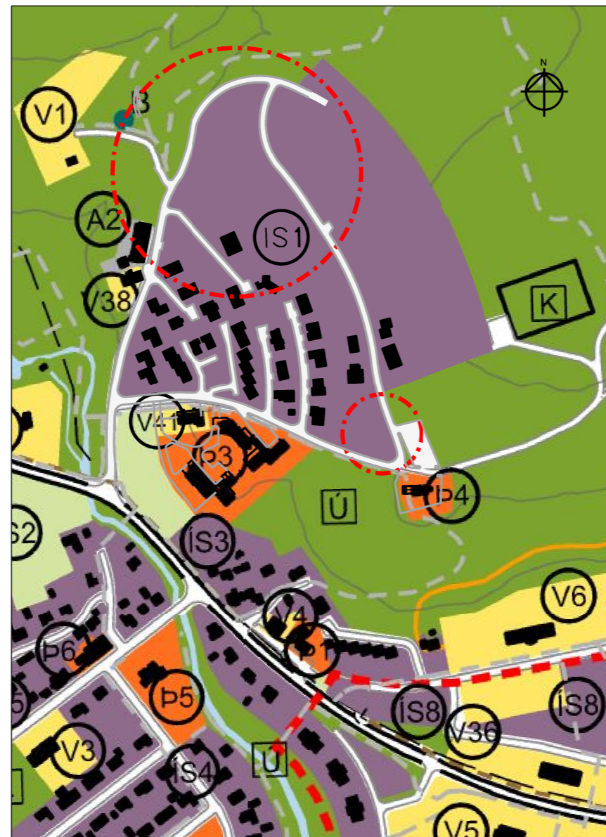
TILLAGA AÐ BREYTINGU Á AÐALSKIPULAGI MKV:1/5000