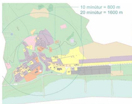
Mynd 16. 10 og 20 mínútna gönguradius út frá núverandi miðju Víkur í Myrdal.

Aðalskipulagsbreytingin er í samræmi við þessi markmið og áherslur landsskipulagsstefnu 2024-2038. Verið er að þetta byggð og bæta við nýjum svæðum fyrir fjölbreyttar lóðir fyrir fjölbreyttar íbúðargerðir, byggð sem tekur mið af þeirri byggð og því byggðarmynstri sem fyrir er í Vík. Skipulagssvæðið er innan 20 mínútna gönguradiusar frá núverandi og framtíðar miðju Víkur og þar er að finna blöndu íbúða, verslunar og þjónustu og samfélagsþjónustu, sem stuðlar að gönguvænni byggð sem dregur úr ferðaþörf. Skipulagið stuðlar að uppbyggingu fjölbreyttra íbúða og þjónustu fyrir fjölbreyttan hóp, m.a. eldri borgara, og styrkir þannig búsetufrelsi.