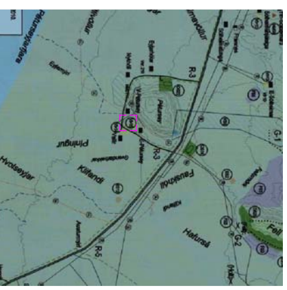
HLUTT ÚR AÐALSKIPULAGI MYRDALSHR. 2012-2028 1:50,000