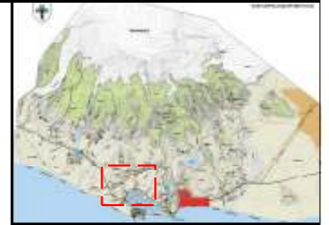
ÚR AÐALSKIPULAGI MÝRDALSHREPPS 2012-2028

Nýtt verslunar- og þjónustusvæði er staðsett á landi sem í gildandi aðalskipulagi er gert ráð fyrir landbúnaði. Tillaga að breytingu á aðalskipulagi er ekki talin draga úr gæðum eða framboði landbúnaðarlands þar sem lítið eða ekkert verður gengið á ræktað land. Uppbygging á svæðinu verður í nágrenni við önnur mannvirki á bæjarstæðinu og mun taka mið af núverandi staðháttum á svæðinu. Breyting á aðalskipulagi er því ekki talin hafa mikil áhrif á landnotkun á aðliggjandi svæðum.