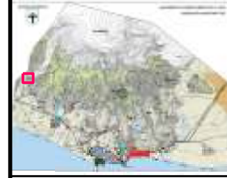
Úr Aðalskipulagi Myrdalshrepps 2011-2028 - Ekki í kvarða.