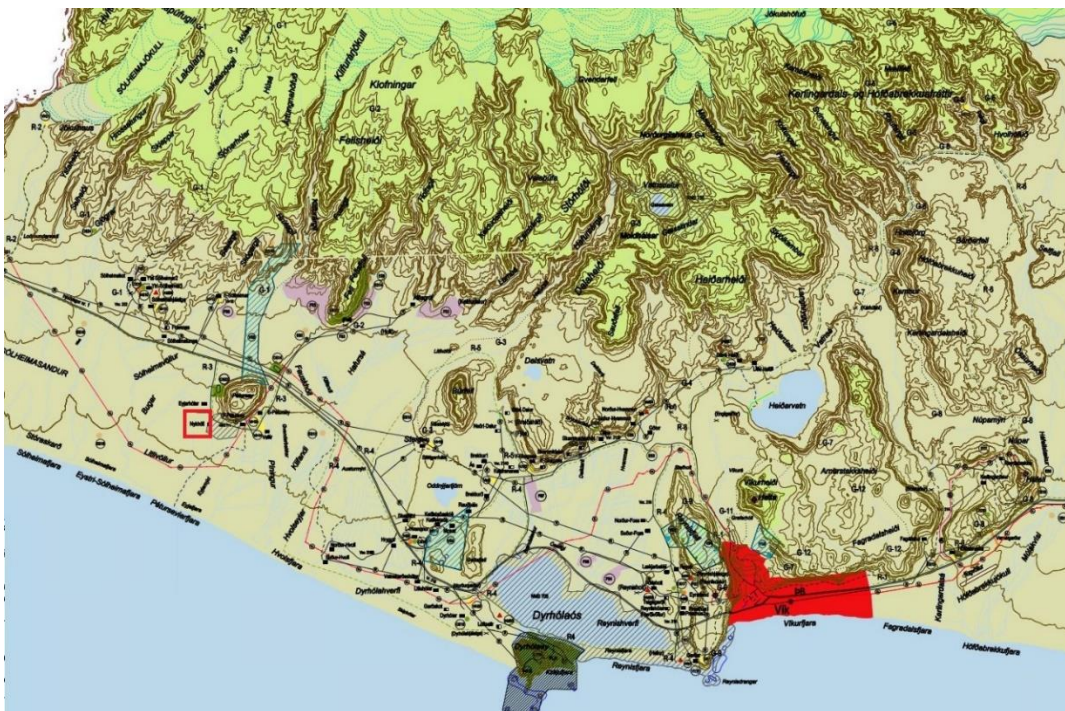
Mynd 1 Staðsetning aðalskipulagsbreytingar

Gert er ráð fyrir því að breyta Aðalskipulagi Mýrdalshrepps 2012-2028 á þann hátt að afmarka verslunar- og þjónustusvæði, þar sem gert er ráð fyrir gisti- og ferðaþjónustu á jörðinni Péturshólar. Svæðið er staðsett á landbúnaðarsvæði á gildandi aðalskipulagi. Á myndum 2 og 3 er sýnd gildandi aðalskipulag og staðsetning fyrirhugaðs verslunar- og þjónustusvæðis.