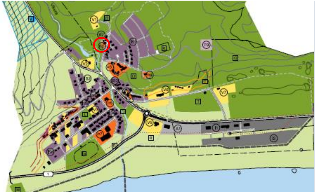
Mynd 1 Staðsetning reitsins sem hugmyndir um breytingar ná til er auðkennd með rauðum hring.

Lögð er til breyting Aðalskipulagi Mýrdalshrepps 2012-2028. Leikskólinn sem rekinn var í gömlu íbúðarhúsnæði við Suðurvíkurveg hefur verið lokað og óskað er eftir að reka þar veitingahús sem myndi samræmast betur landnýtingarflokki „Verslun og þjónusta“ en núverandi landnotkunarflokki „Þjónustustofnun“. Um er að ræða stakstætt hús á lóð sem ekki á mörk að íbúðabyggð en slökkvilið bæjarins er í næsta húsi. Handan Suðurvíkurvegar eru tvær íbúagötur, núverandi byggð og fyrirhuguð byggð fyrir 9 sérbýlishús.