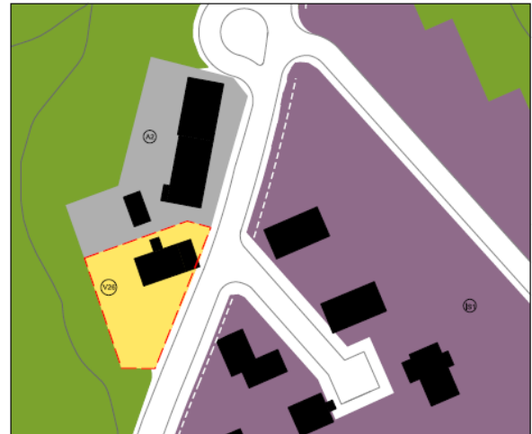
Mynd 2 Hugmynd að breytingu