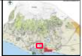
ÚR AÐALSKIPULAGI MÝRDALSHREPPS 2012-2028

Norður Foss er nokkuð nálægt kjaranum á Vík og í nálægð við aðra uppbyggingu. Skammt frá Norður Foss er svæði V30 þar sem gisti- og ferðaþjónusta er skilgreind, frístundabyggð í landi Reynidals (F2) sem og félagsheimilinu í Eyjarlandi. Með skipulaginu er uppbyggingu beint í nágrenni við þegar upp byggð svæði en ekki byggt upp á ósnortnum svæðum í mikilli fjarlægð frá þéttbýli og annari uppbyggingu.