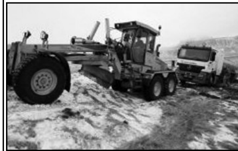
Mjólkurbíll útaf í Mýrdalnum

Upplýsingar og skráning hjá Áslaugu Vilhjálms í síma 487-1163 og 865-7047