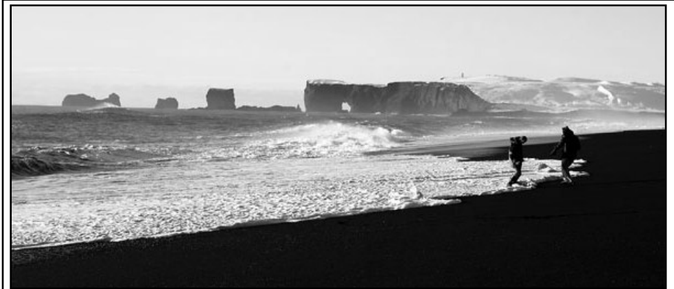
Skemmtileg mynd frá öðru sjónarhorni af Dyrhólaey sem Jónas í Fagradal tók í sl. viku