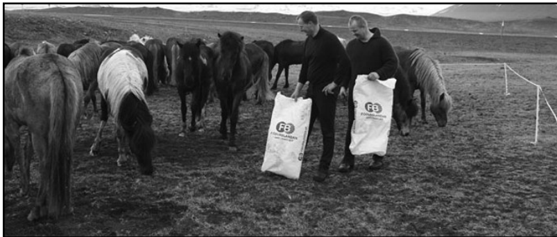
Það þarf að sinna fóðrun hestanna og hlynna að þeim á annan hátt