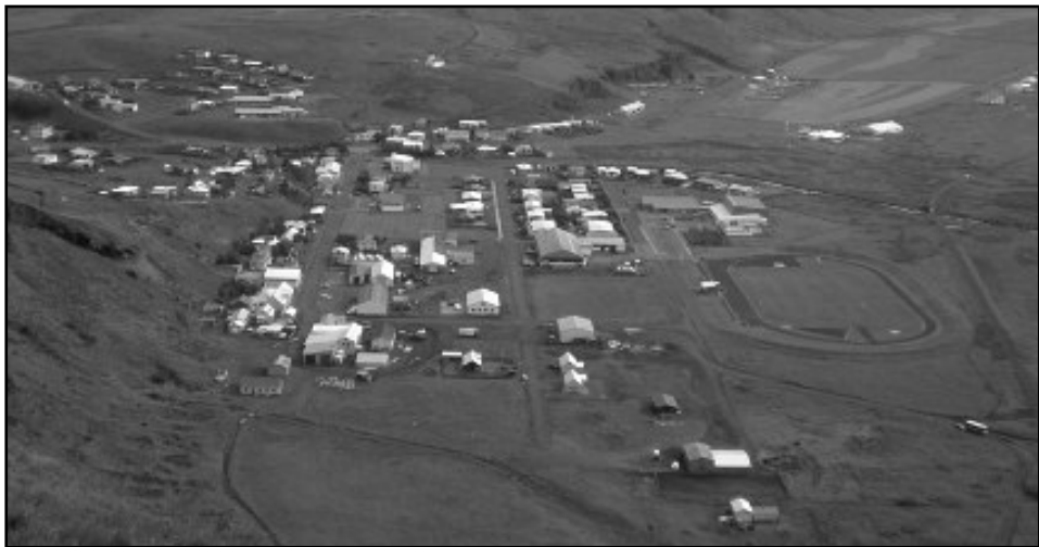
Skemmtileg mynd af Víkurþorpi tekin af Reyni Erni Eypórssyni.

Aðalfundur Dynskóga, Sögufélags Vestur-Skaftfellinga var haldinn á Ströndinni Víkurskála laugardaginn 23. maí sl.