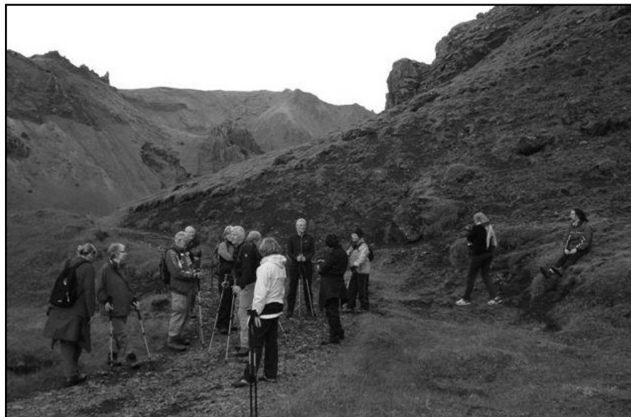
Góð þátttaka hefur verið í gönguferðum Ferðafélags Mýrdælinga vítt og breytt um Mýrdalinn. Myndin er frá Jónsmessugöngu inn á Höfðabrekkuafreitt.

Sveitarstjórn samþykkir að taka lán hjá Lánasjóði sveitarfélaga að fjárhæð 35.000.000 kr. til 10 ára í samræmi við lánstilboð sem liggur fyrir fundinum. Til tryggingar láninu standa tekjur sveitarfélagsins, sbr. heimild í 3. mgr. sveitarstjórnarlaga nr. 45/1998. Lánið er tekið til að fjármagna lokaáfangar byggingar íþróttamiðstöðvar á Kirkjubæjarklaustri, sbr. 3. gr. laga um stofnun opinbers hlutafélags um Lánasjóð sveitarfélaga nr. 150/2006.