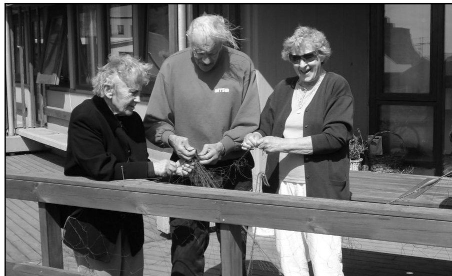
Netavinna í blíðviðrinu hjá heimilisfólkinu á Hjallatúni í Vík á dögnum.