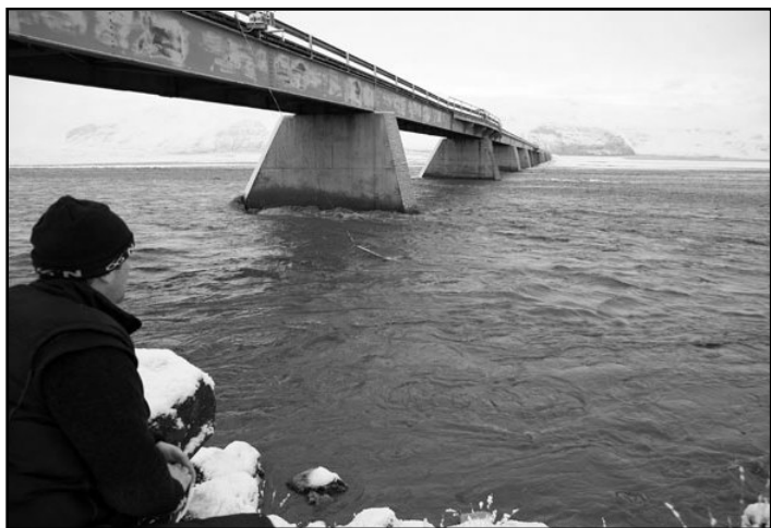
Skeiðará í byrjun desembermánaðar. Þá kom lítið hlaup í ána.