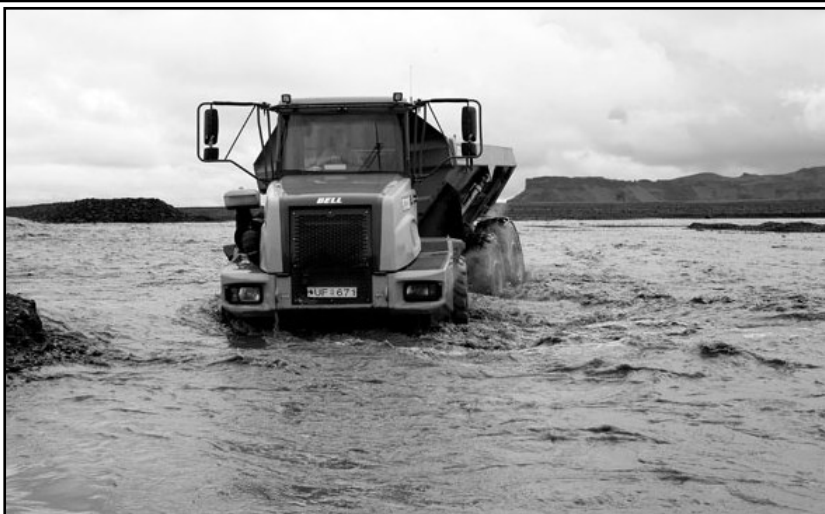
Það hefði þótt gott að hafa svona tæki þegar vatnagangurinn var á Mýrdalssandi árið 1955