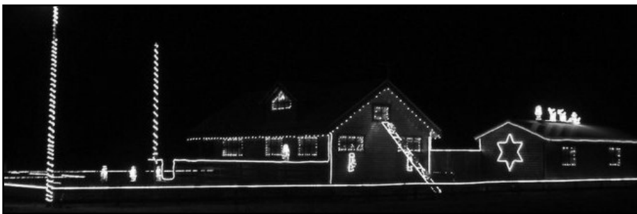
Víkurbúar voru duglegir við að skreyta hús sín fyrir jólin, og voru Útlagarnir þar einna harðastir.