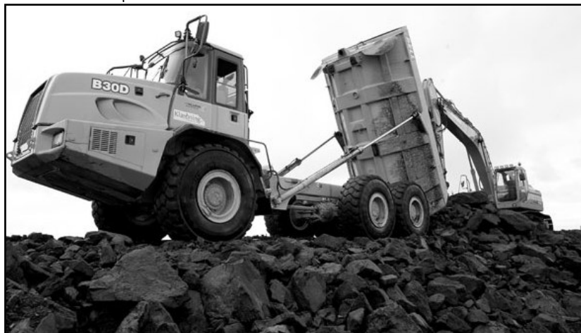
Hlassinu sturtað af