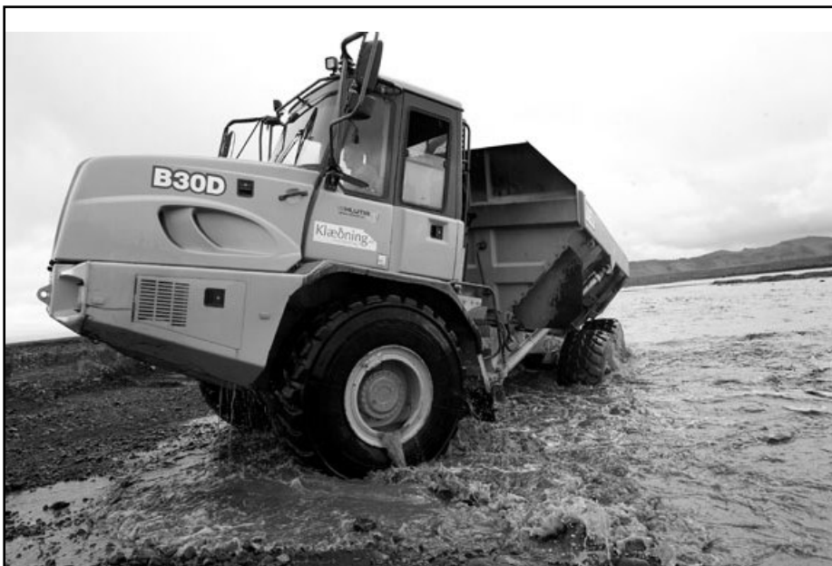
Búkollan snýr bara upp á sig, en hún er liðstýrð. Myndirnar af Búkollu og vegaf framkvæmdum: Jónas Erlendsson