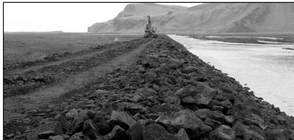
Myndin sýnir vel legu garðsins