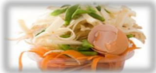
Domowe odpadki organiczne

Do Brązowego pojemnika wyrzucamy m.in. wszelkie resztki jedzenia, rośliny i inne odpadki organiczne z domu. Ważnym jest aby wszystkie te odpadki wyrzucać w torbie ekologicznej (torby kukurydziane) zanim wrzucimy je do brązowego pojemnika.